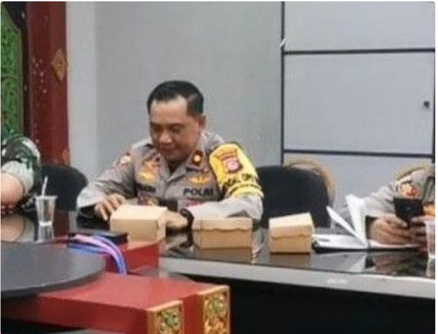
Kabagops Polresta Mataram saat menghadiri Rakor di Kantor Bupati Lombok Barat, Selasa (10/12/2024)

MATARAM, NTB – Dua tradisi budaya ikonik, Pujawali dan Perang Ketupat, akan